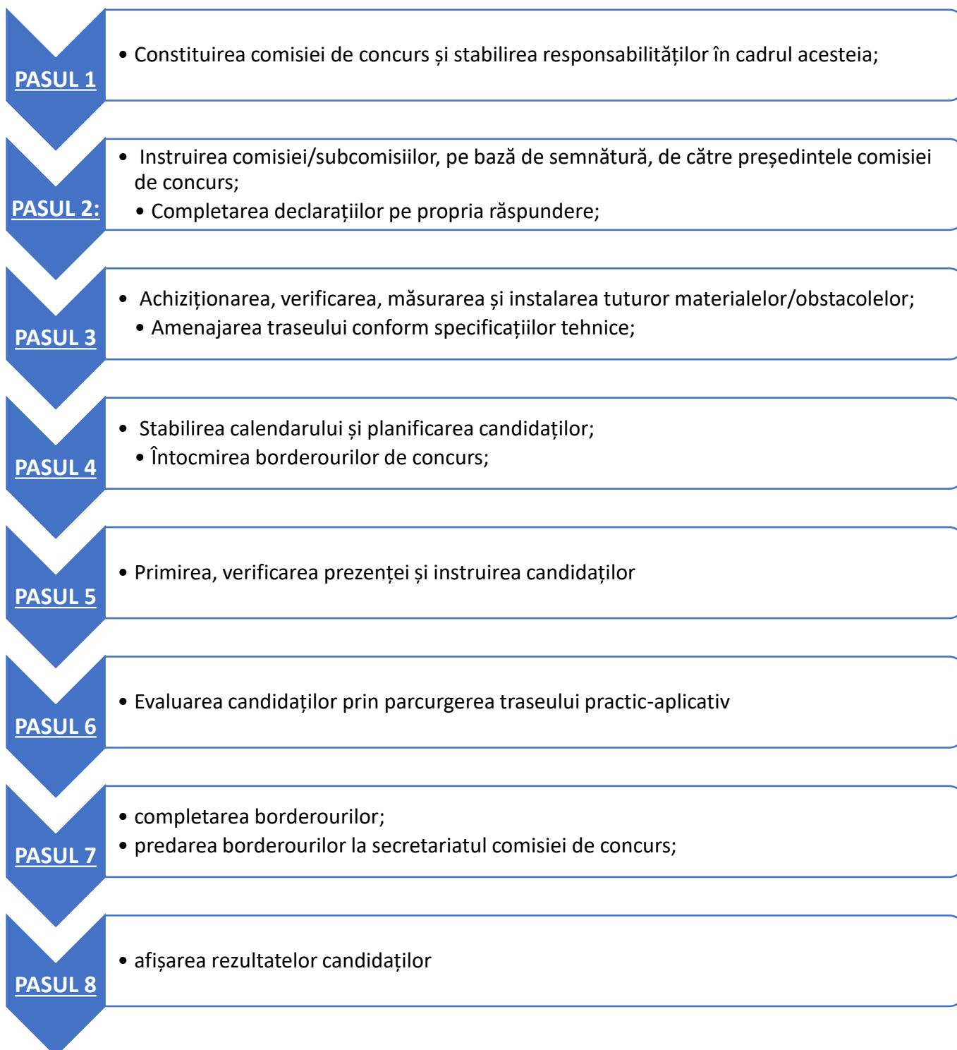
DIAGRAMA DE PROCES